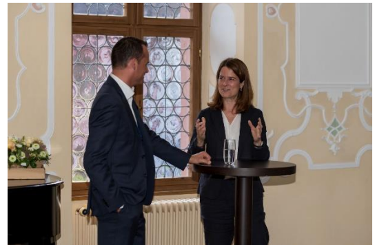
Nominationsversammlung FDP Hitzkirch