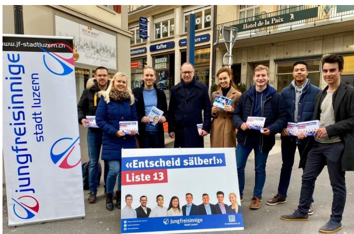
Wahlkampfveranstaltung Jungfreisinnige Stadt Luzern