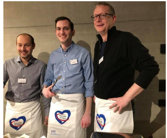
Wahlkampfveranstaltung FDP Kriens