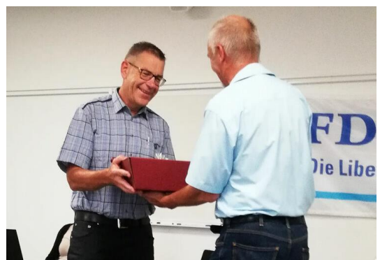
Parteiversammlung FDP Eglolzwil