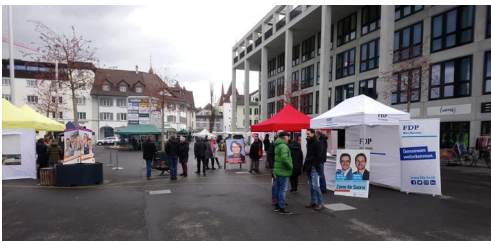
Wahlkampfveranstaltung FDP Sursee