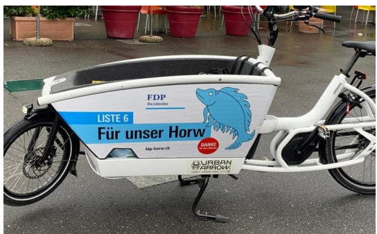
Mobiler Wahlkampf der FDP Horw